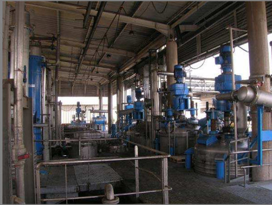
Batterie d'extracteurs à fond filtrant 3000 à 6800 L. Capacité annuelle de traitement : 5000 T. +évaporateurs à flot tombant 3000 L sous vide