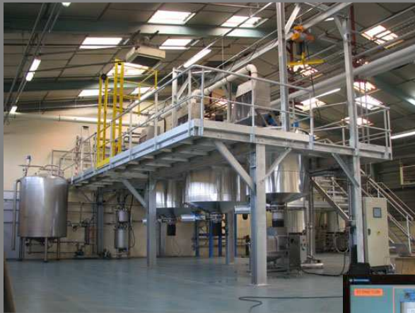
Unité d'extraction aqueuse avec concentration sous vide et pasteurisation

Intégration de matériels d'occasion révisés