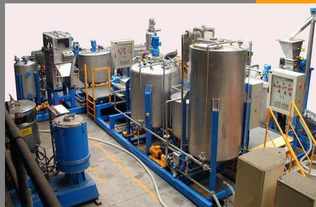
Skid de mélange/dosage/séparation (centre de recherche).