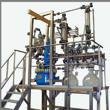
Pilote de synthèse 100 L.