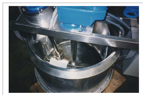
EJJ 120 sur cuve 400 litres avec racleurs